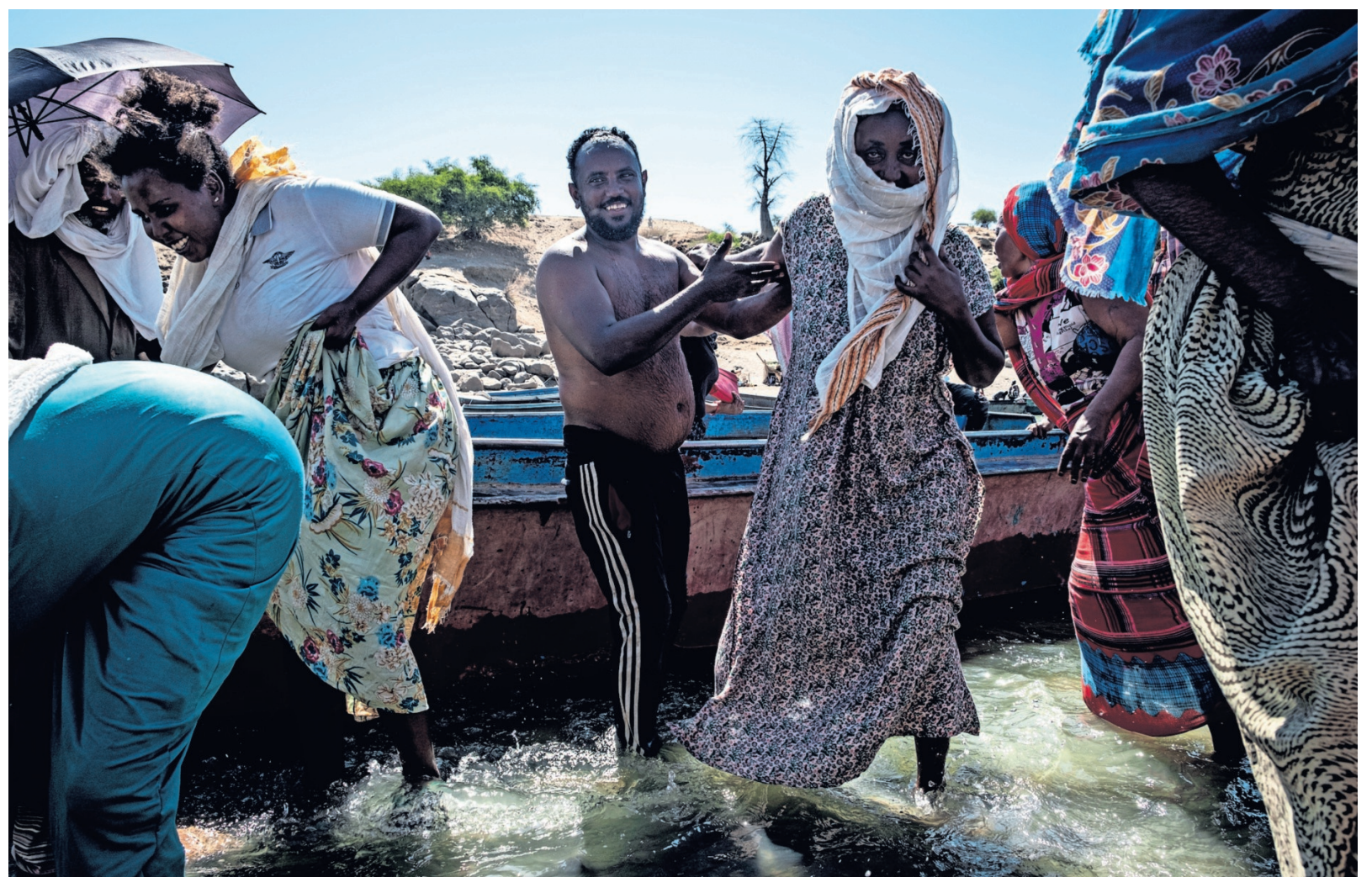
Per boot steken Ethiopische vluchtelingen de grensrivier met Soedan over. Het worden er steeds minder.

Contact krijgen lukt niet: het internet- en telefoonnetwerk is geblokkeerd