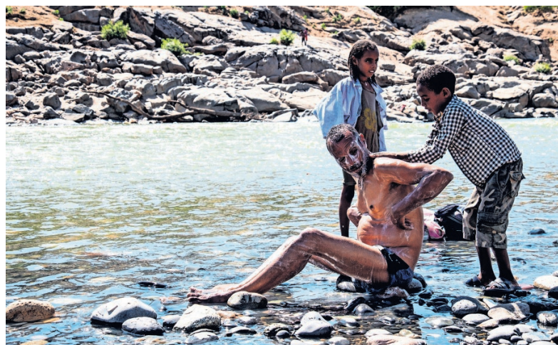
Een jongen helpt zijn vader, die zich wast in de grensrivier de Tekeze.

Ondertussen is het aantal vluchtelingen in Soedan volgens de VN-vluchtelingenorganisatie opgelopen tot 43.000. Dagelijks vertrekken ou-