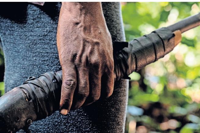
Zwarte tape en een lasbeurt houden de lange loop en houten kolf van Fofana's oude geweer bij elkaar.