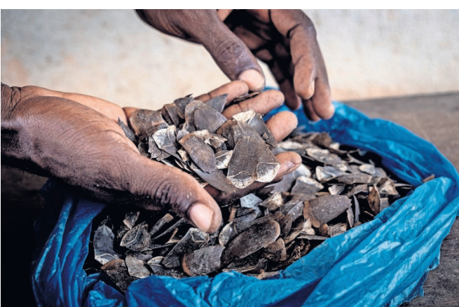
De schubben worden aan China verkocht als medicijn.

niet alleen een levensbehoefte, maar ook een gewoonte van grote culturele waarde. "Als je als familie samenkomt, dan is een maaltijd van wild het traditionele gerecht. Het is onmogelijk om dat te verbieden."