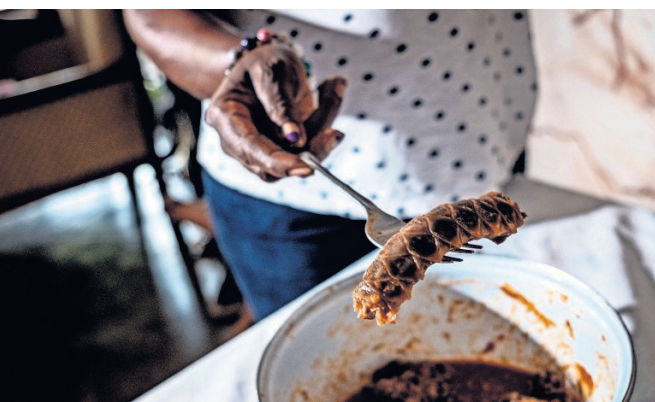
In Ivoiriaanse restaurants kost een portie schubdier meer dan een bord kip of rund.