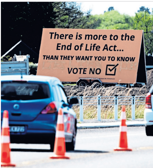
Billboard met een oproep om in het referendum 'Nee' te stemmen.

Een volksraadpleging over recreatief cannabisgebruik, dat tegelijk met het euthanasiereferendum werd gehouden, moest het mogelijk maken voor Nieuw-Zeelanders om 14 gram marihuana per dag te kunnen kopen en zelf twee cannabisplanten te kweken. Die wet kan volgens de prognoses niet op genoeg steun rekenen; ruim 53 procent stemde tegen. Die voorlopige uitslag kan er door de 'speciale stemmen' nog wel anders uit gaan zien.